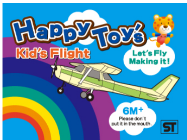
アナログ印刷機で印刷したラベル