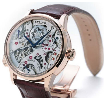
クレドール スプリングドライブ ソマリ