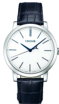
クレドール スプリングドライブ 叡智Ⅱ