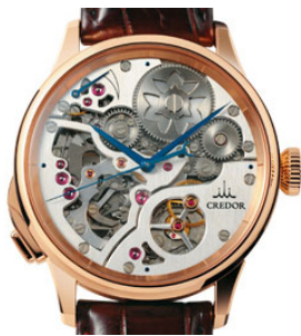
クレドール ミニッツリピーター

「クレドール ミニッツリピーター」という、時間を音で知らせる機構を搭載した3,500万円（税抜）の腕時計や、非常にシンプルでありながら、未永く代々にわたって使っていただけるように、部品の隅々まで磨き上げた腕時計「クレドール 叡智Ⅱ」570万円（税抜）などを製造しています。マイクロアーティスト工房製の時計の特徴である手仕上げの工程は、全て塩尻事業所内で行っています。