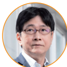
放送大学教授 中川一史氏

テーマを設定して、プログラミングで作品を作り、発表するという一連の流れの中で、プログラミングの効果を子供たち自身が実感できるのがいいですね。プロジェクションマッピングのワクワク感が相乗効果になって「次はもっとこうしたい」という意欲にもつながります。プログラミング教育に大切なイメージーションとクリエイションを引き出してくれる教材です。